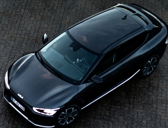
For bare 4.995,- kr. om måneden kan man nu privatlease en Kia EV6